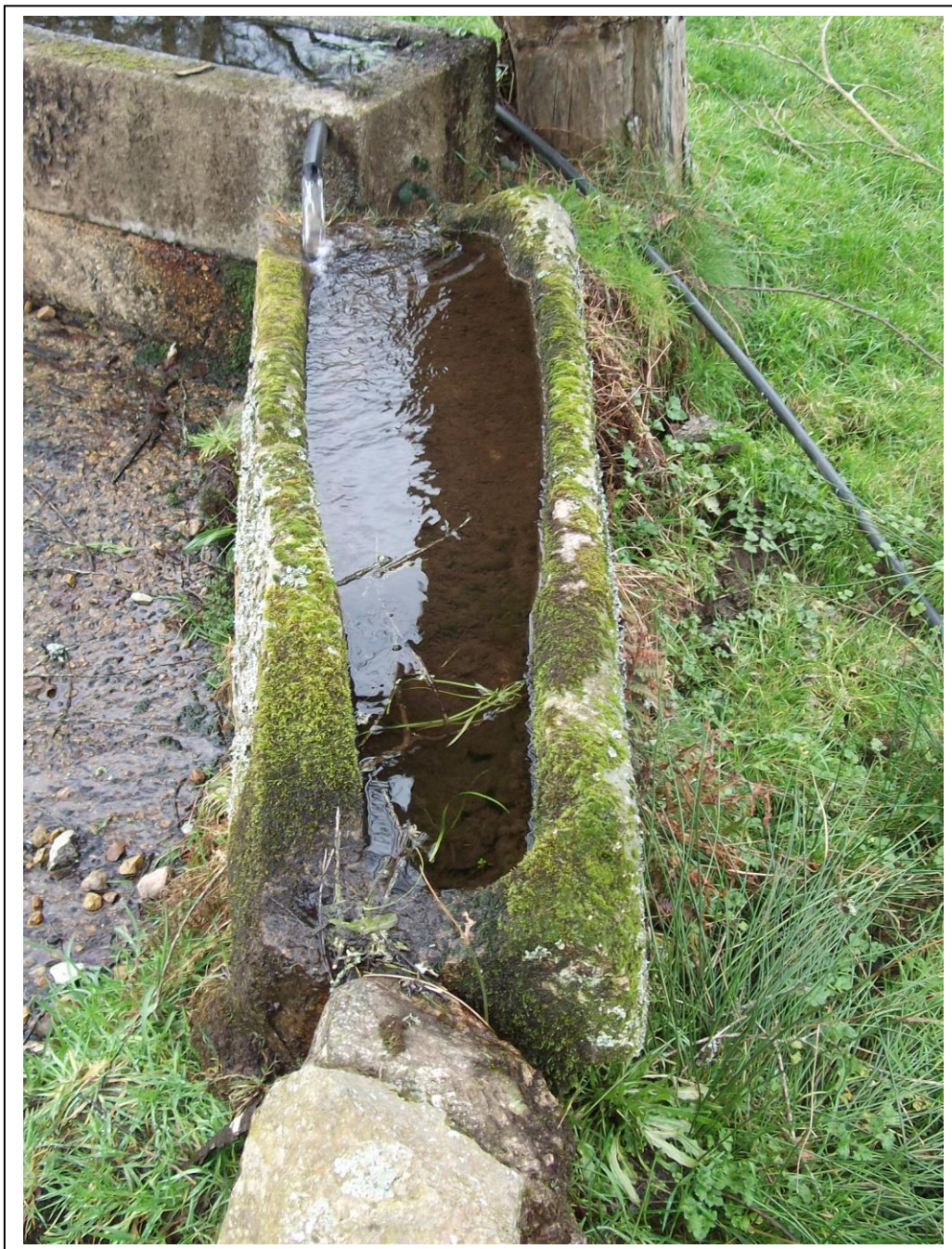
1.3- Vista do sarcófago desde a parte traseira. Desde este ángulo pode apreciarse a forma de silueta humana escavada no bloque de granito.